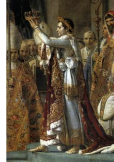
David, Coronación Napoleón, detalle.