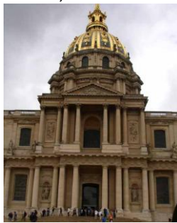
Palacio de los Inválidos, París, Francia.