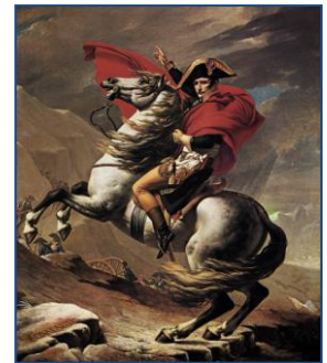
David, Napoleón, paso de los Alpes.