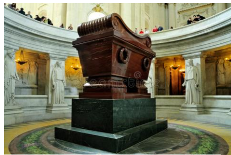
Mausoleo de Napoleón.