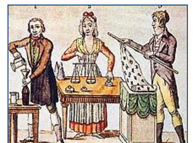
Grabado de 1793 que ilustra el litro, el gramo y el metro.