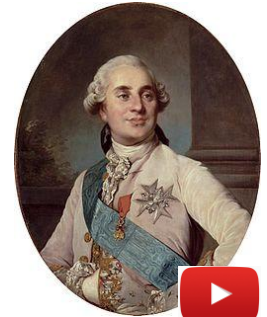
Luis XVI, rey de Francia.