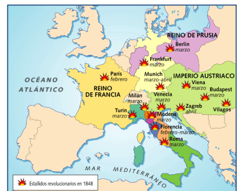
Revoluciones de 1848.

ACTIVID. 1 y 2. Pág. 36: Pág. 37: 3, 4 y 5.