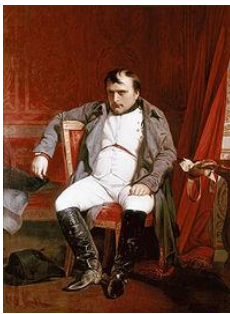
Napoleón abdicando en Fontainebleau.