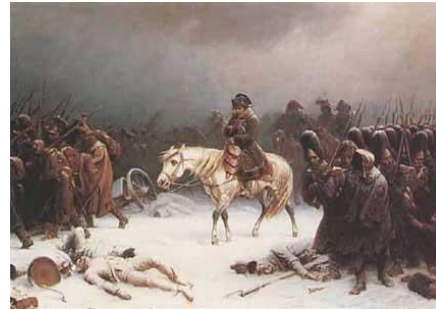
Napoleón avanzando con sus tropas en Moscú en llamas (izq.). Napoleón retirándose de Moscú (derch.)