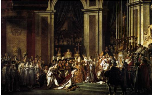
David, Coronación Napoleón. Nôtre-Dame